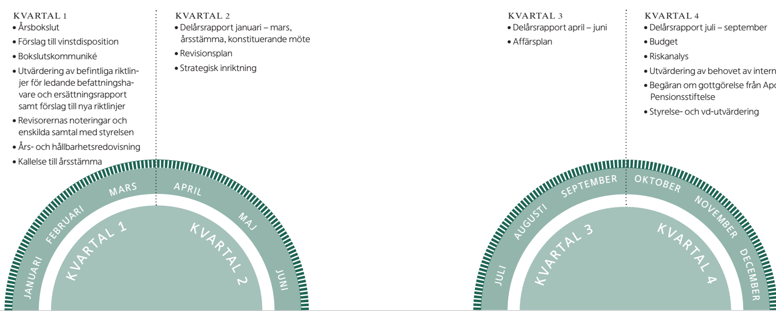
STYRELSEÅRET: UNDER 2024 HAR 11 STYRELSEMÖTEN HÅLLITS, INKLUSIVE DET KONSTITUERANDE MÖTET. OVANSTÅENDE ÄRENDEN BEHANDLADES UNDER ÅRET.